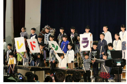
3年 『咲かせよう! ありがとうの花』