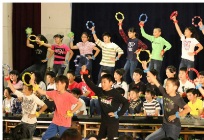
5年 『情熱大陸～52人の人生』