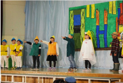
4年 『オズの魔法使い』