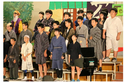
6年 『MITO KOMON』