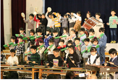
1年 『いきものだいすきいちねんせい』

10月21日(日)『学芸会』を実施し、各学年が音楽や演技を通して表現力を発揮しました。温かい拍手を惜しみなく送ってくださった保護者の皆様、地域の皆様、ありがとうございました。