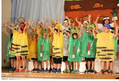
2年 『はたけのしたはおおさわぎ』