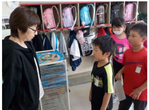
上がり九九 や 下がり九九 (逆から言うものです) 合格すると シール。