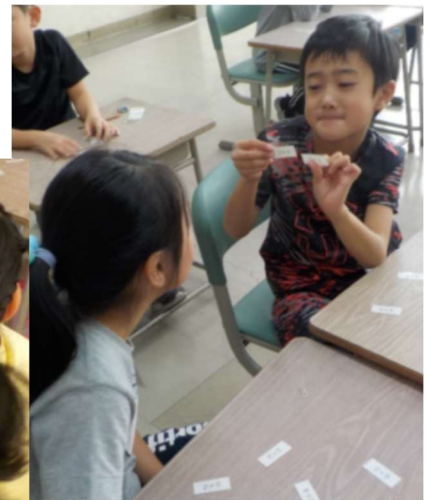
裏には担任が手書きした答え