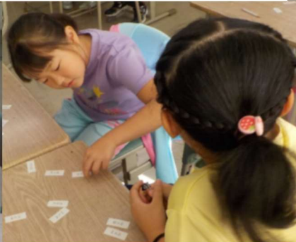
隣同士 順番に 問題を出しあいます。