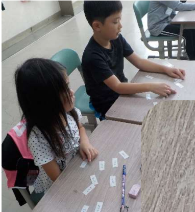
2年生が机の上に カードを並べています。