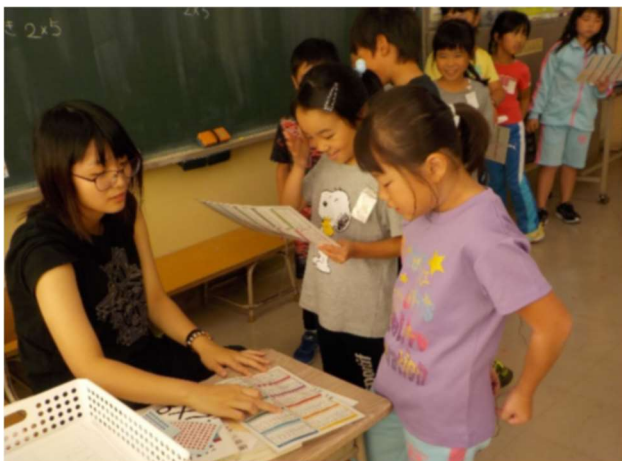
今度は九九の表を持って 検定。 教室の前と後で 挑戦！